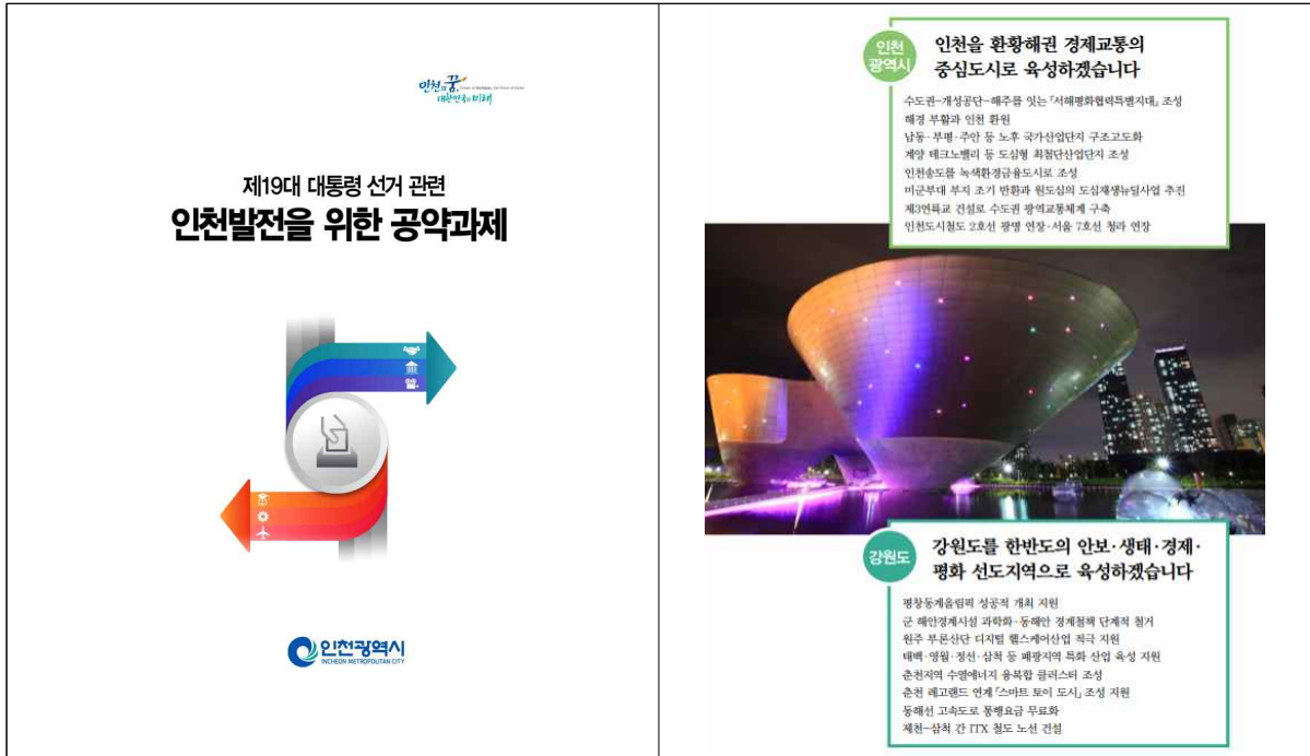
[그림 3] 제19대 대선 인천연구원 아젠다 선정